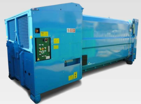
Cassoni e compattatori scarrabili monopala e a cassetto