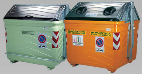
Cassonetti metallo RSU/RD 2400-3200 litri stazionari