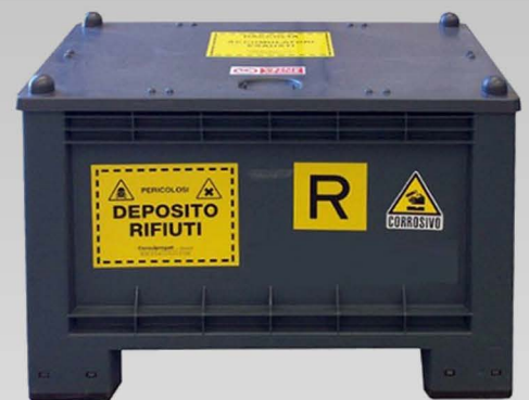
Contenitori per accumulatori e rifiuti pericolosi