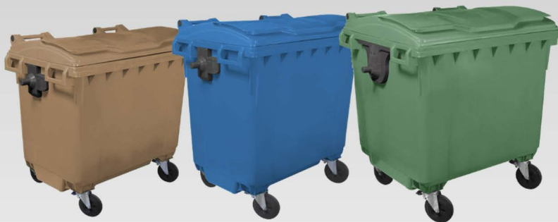
Cassonetti HDPE 660-770-1100 litri coperchio piano