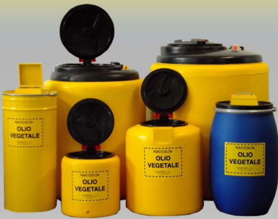
Contenitori olii esausti (minerali e vegetali)