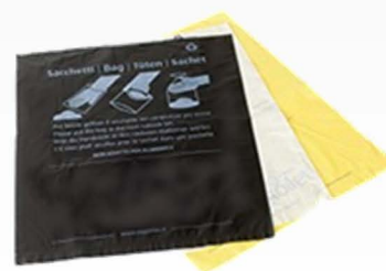
Contenitori, dispenser e sacchetti per deiezioni canine