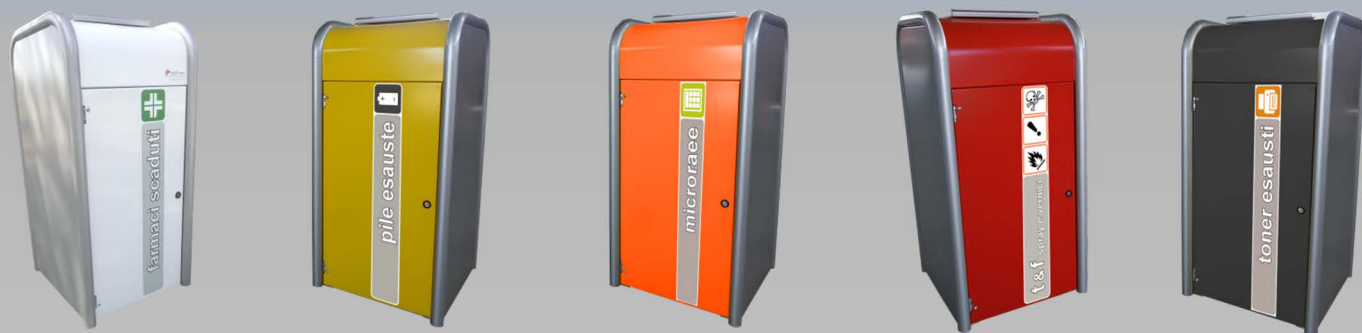
Contenitori per rifiuti urbani pericolosi