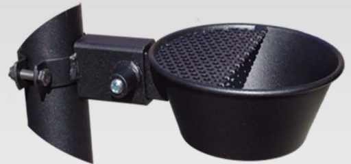
Portacenere a muro e da palo