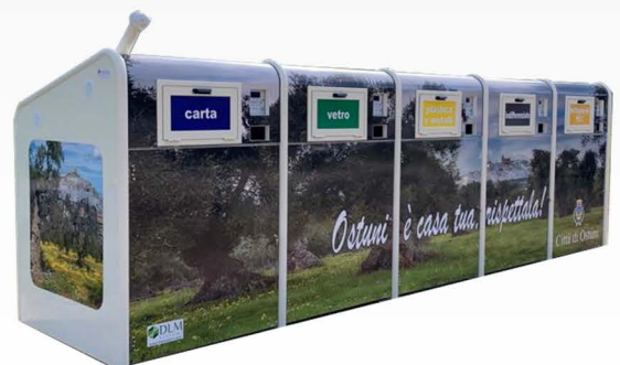
Ecocompattatori ed ecoisole a riciclo incentivante