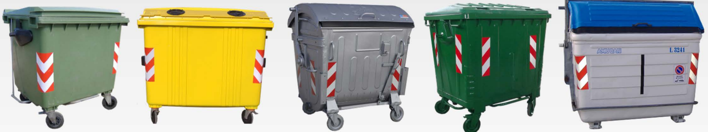
Cassonetti rigenerati in polietilene e metallo