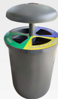
Contenitori ed isole per raccolta differenziata