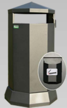
Cestini e cestoni gettacarte