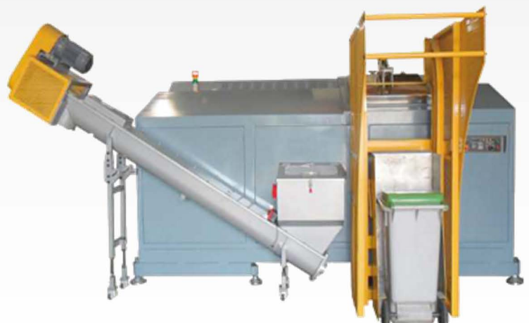
Impianti di compostaggio per piccole comunità