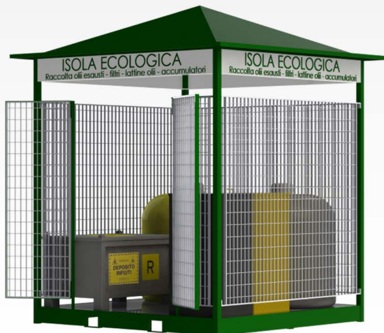
Box per contenitori rifiuti pericolosi