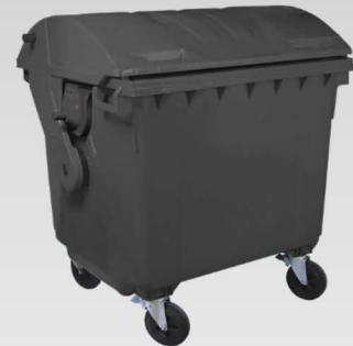
Cassonetti HDPE 1100 litri coperchio basculante