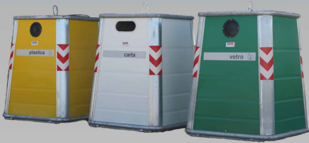
Campane in metallo 2,2-3,0 mc.