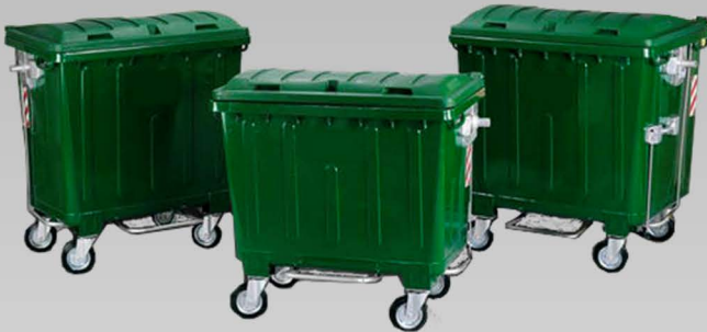
Cassonetti metallo RSU/RD 660 - 770 - 1100 - 1700 litri coperchio piano