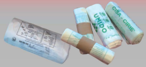
Sacchi in polietilene, con RFID e sacchi biocompostabili