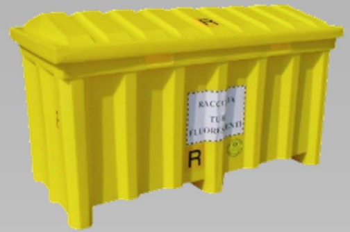
Contenitori filtri olio e tubi fluorescenti