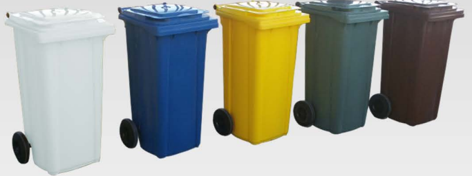
Contenitori carrellati HDPE 120 - 240 - 360 litri